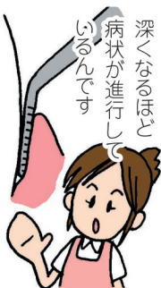
歯周ポケットの深さと歯周病の進行具合

健康な状態では深さは浅く3mm未満、軽度で3mm~5mm、中等度で5mm~7mm、重度で7mm~と徐々に深くなります。