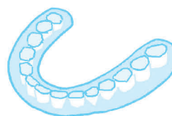
スプリント療法 (マウスピース)