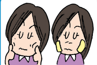
マッサージや湿布