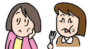
習慣や癖を修正する 行動療法

治療法には、開口訓練、マッサージや湿布、スプリント(マウスピース)療法、習慣や癖を修正する行動療法、薬物療法、外科的治療などがあり、症状によって組み合わせて治療を進めていきます。顎関節に影響を及ぼす悪い生活習慣の改善など、自宅でのケアも治療の重要なポイントです。