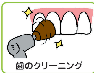
歯のクリーニング