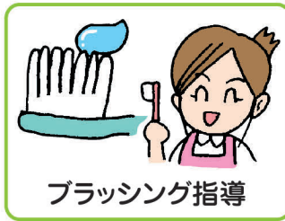
ブラッシング指導