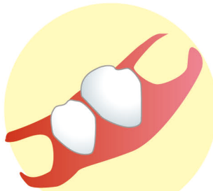
金属のバネが無い入れ歯