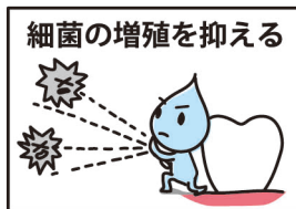
細菌の増殖を抑える