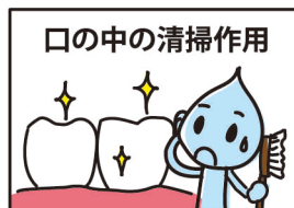
口の中の清掃作用