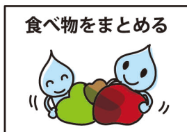
食べ物をまとめる