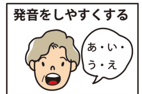
発音をしやすくする