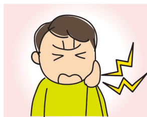
顎の付け根(顎関節)や その周辺が痛い